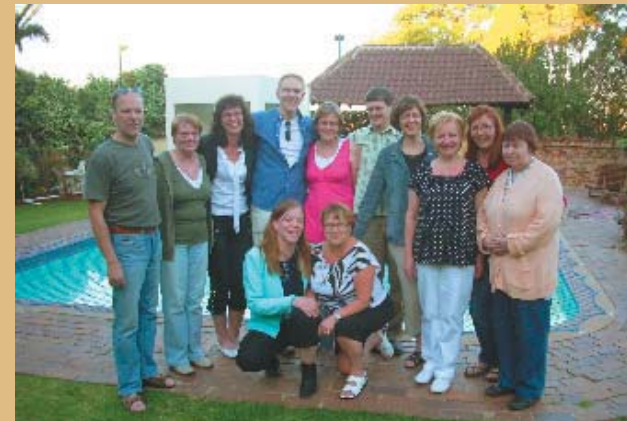
"Tämän porukan kanssa voi lähteä ihan minne vaan," tuumasivat matkalaiset.

Healing Rooms Finland ry siunaa Jeesuksen nimessä tehtävää Jumalan valtakunnan työtä kaikkialla maailmassa. Uskomme, että Jumala toimii monin tavoin, monia muotoja ja erilaisia palvelijoita käyttäen. Matkakertomus on yksittäisten henkilöiden kokemuksiin perustuva todistus Jumalan suuruudesta ja ihmeteista. Tuokoon se kunnian ja ylistyksen Jumalalle, Herrallemme Jeesukselle Kristukselle, ja rohkaikoon meitä kaikkia!